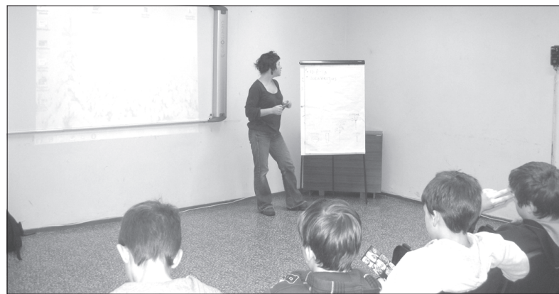
Susitikimas su režisierė Jūrate Samulionyte.

9–10 klasių mokiniai dalyvavo susitikime su režisierė Jūrate Samulionyte. Režisierė jiems papasakojo, kaip buvo kuriamas fotofilmas „Nerutina“.