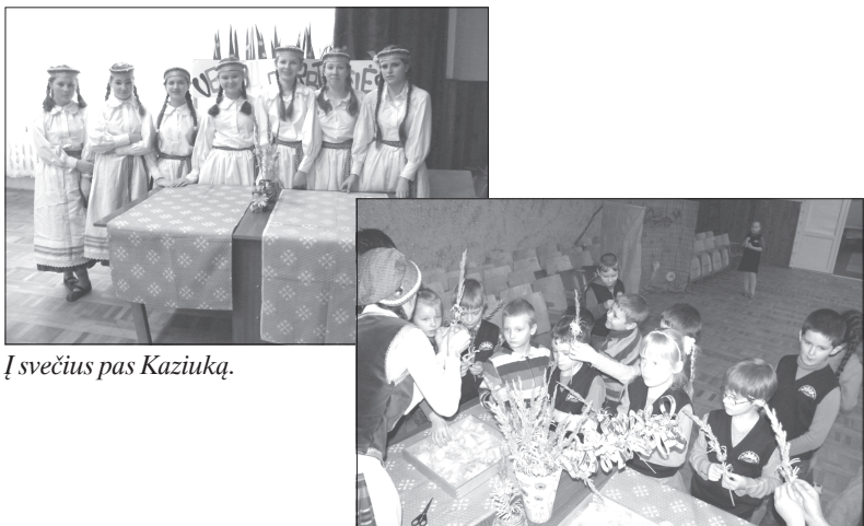
Į svečius pas Kaziuką.

O jau mugės turtingumas! Čia puikavosi dirbiniai iš molio, rankų darbo papuošalai, mezginiai, kepiniai. Ir aš ten buvau, molinę puodynę įsigijau ir su nuotaika namo grįžau („Naujienos“, str. autorė Regina Šereikė).